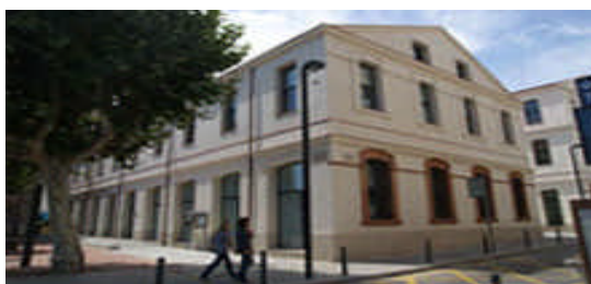
Centre Cívic Cabot i Barba

La formació es realitzarà els dies 11, 16, 18, 23 i 25 d'abril de 2013 al Centre Cívic Cabot i Barba de la ciutat de Mataró, en horari de 9 a 14 h.